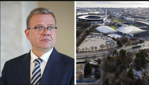
Garden Helsinki -hallia suunnitellaan Helsingin Töölöön.